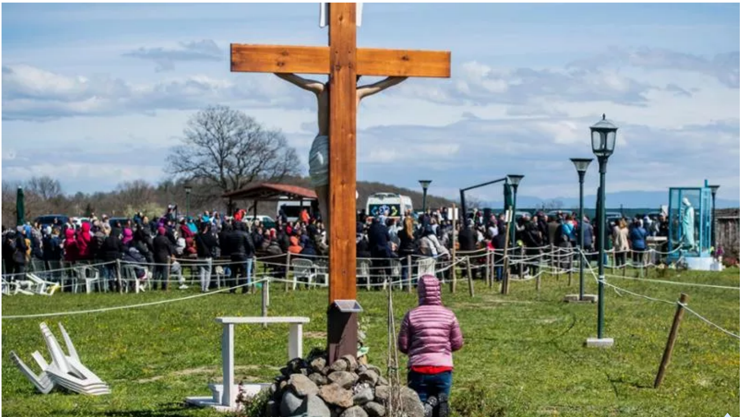
Rosario e preghiera a Trevignano

10 Aprile 2023 alle 19:00 | 1 minuto di lettura