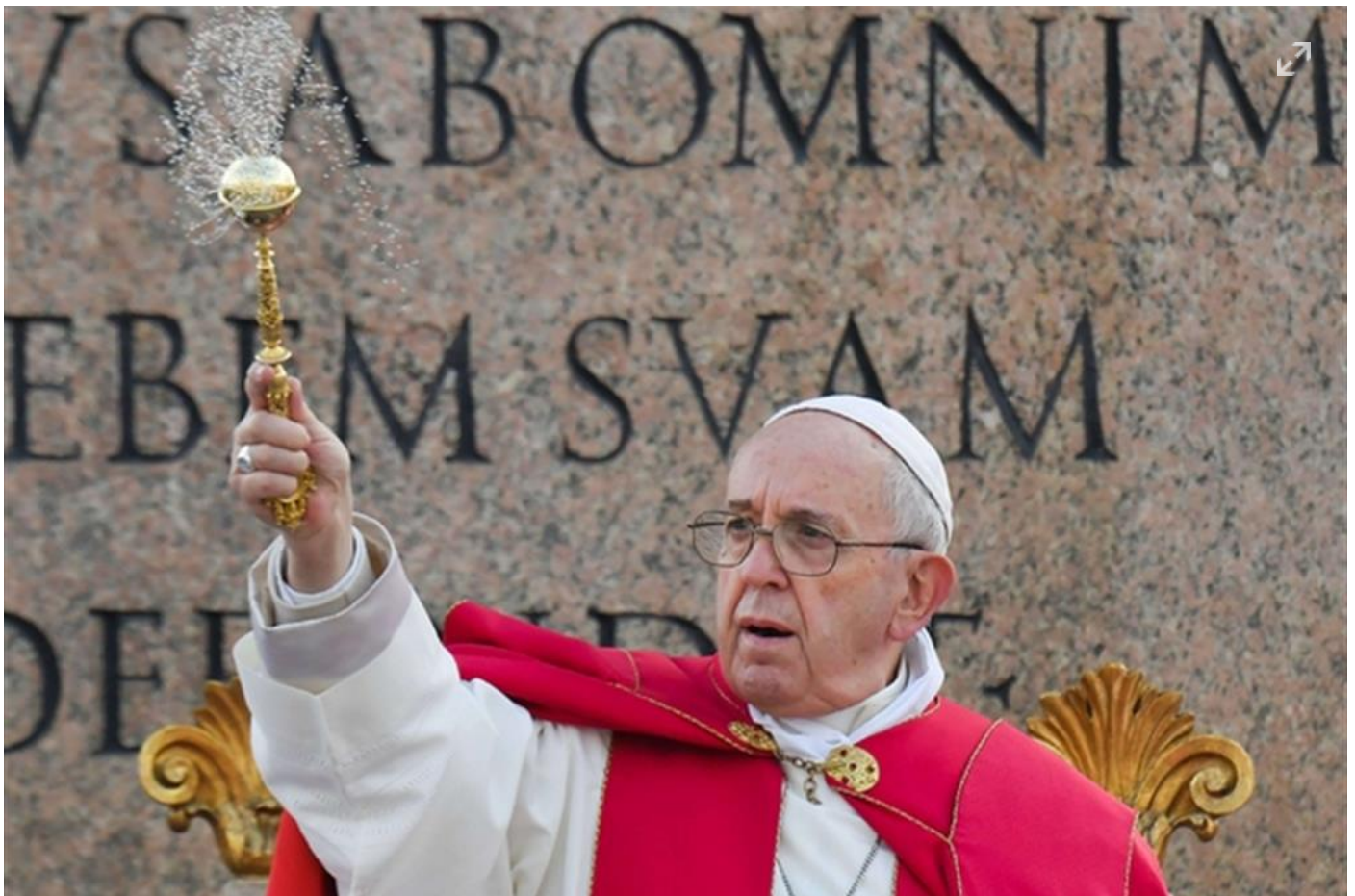
Domenica delle Palme, la benedizione di papa Francesco

Programmazione speciale su Tv2000 per la settimana santa. Dirette, film e documentari giorno per giorno