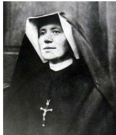
Qui sopra ritratto fotografico di suor Faustina Kowalska; in basso il volto della Divina Misericordia dopo il restauro del 2003 e accanto l'immagine della Sindone; nella pagina a fianco, in basso, l'interno del santuario di Vilnius

e soprattutto dell'immagine che il Signore in persona le chiede di realizzare. Dopo varie vicissitudini don Sopočko accetta di aiutarla e la porta nello studio del pittore Eugenio Kazimirowski. Siamo nel 1934. Suor Faustina, che non abita distante, tutti i giorni, con il permesso della madre superiora, si reca di persona a casa del pittore per seguire la realizzazione dell'opera. Sono giorni duri. La suora polacca è meticolosa e precisa. Talvolta, poiché rattristata per la difficoltà di dipingere la bellezza di Gesù, diventa pedante. Vuole verificare sempre di persona ogni momento dell'elaborazione dell'opera per controllarne la corrispondenza con le proprie visioni. E non risparmia all'artista consigli e correzioni. Ci vorranno ben sei mesi di duro